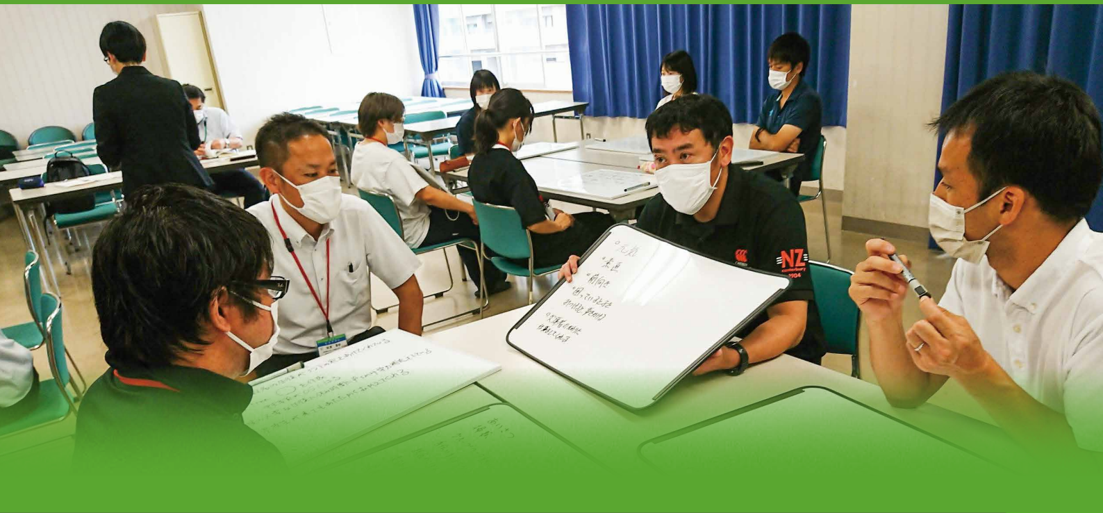
徳島型メンター制度，SECIモデル，ナレッジマネジメント